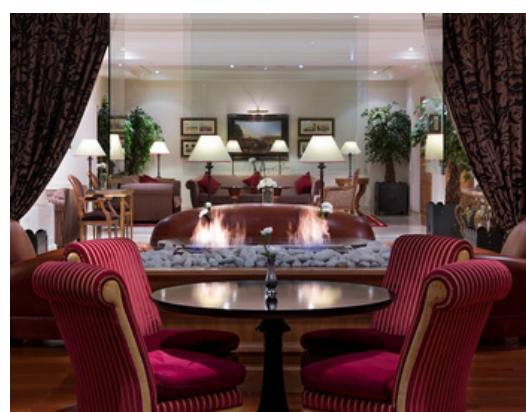
Le Bogie's Bar